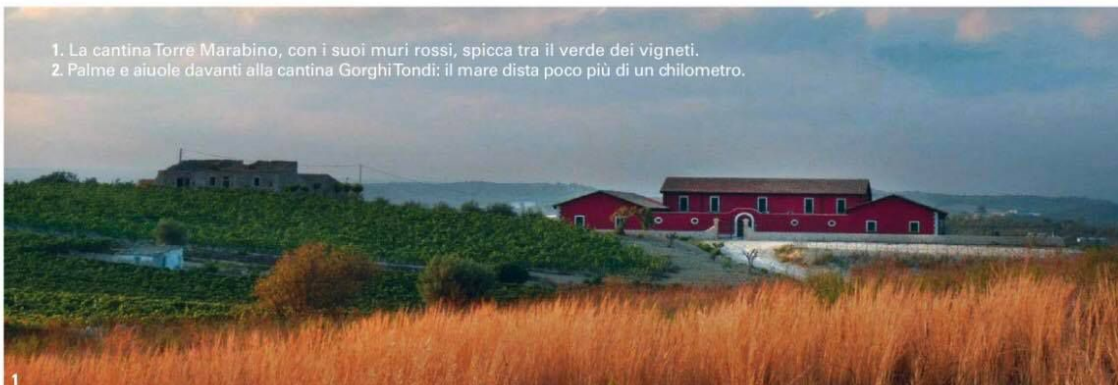
1. La cantina Torre Marabino, con i suoi muri rossi, spicca tra il verde dei vigneti. 2. Palme e aiuole davanti alla cantina GorghiTondi: il mare dista poco più di un chilometro.

recupero conservativo da parte dell'azienda Firriato, il complesso dal 2015 è tornato in vita all'insegna dell'accoglienza, della convivialità e del buon bere. Il valore aggiunto è la posizione mozzafiato, in cima a una collina con vista su Trapani, le saline e le Egadi, i cui profili emergono all'orizzonte. A portata di mano le spiagge: quella di San Giuliano dista solo 10 chilometri. Le camere sono 11, sobrie ed eleganti, perfetta sintesi tra struttura storica e moderno hotel di charme. Nulla è lasciato al caso, tantissime sono le attività proposte, dalle cooking class alle visite in vigna e ai pacchetti soggiorno con degustazioni alla cieca o in abbinamento con light lunch . Da non perdere il tramonto al Belvedere Sky Lounge, sorseggiando un bicchiere di Grillo.