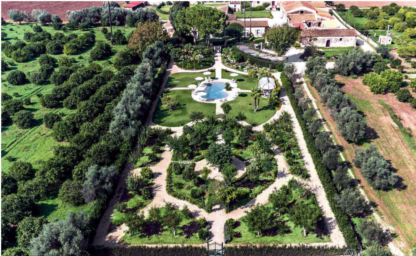
A sinistra, il parco del Donna Coraly, country boutique hotel a Siracusa. In basso, a destra, il Wine Relais Feudi del Pisciotto a Niscemi (Caltanissetta).